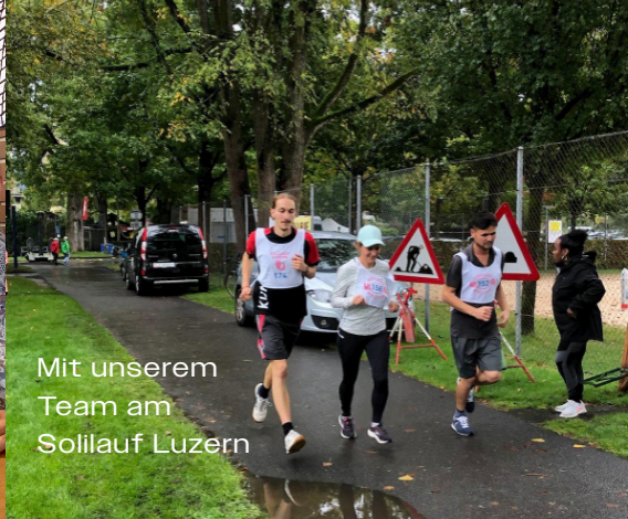
Mit unserem Team am Solilaufluzern