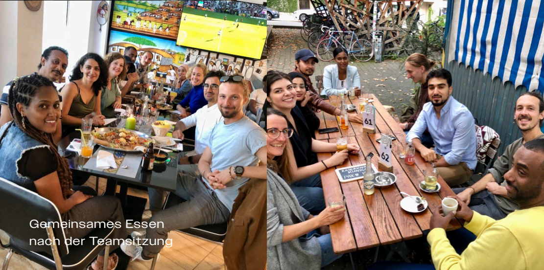
Gemeinsames Essen nach der Teamsitzung