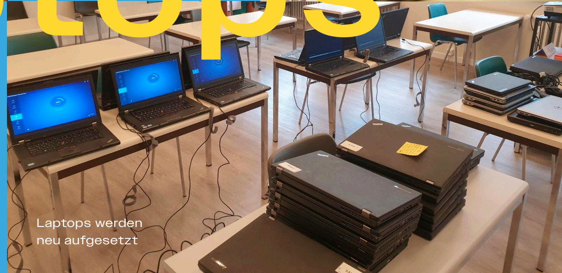
Laptops werden neu aufgesetzt

Wir verliehen und verkauften auch letztes Jahr Occasion-Laptops an Menschen mit Sozialhilfe oder tiefem Einkommen. Sie erhalten dadurch Zugang zur digitalen Welt. Bei Anwendungsproblemen oder Fragen erhalten sie seit Oktober 2022 Hilfe in unserem Laptop-Helpdesk.