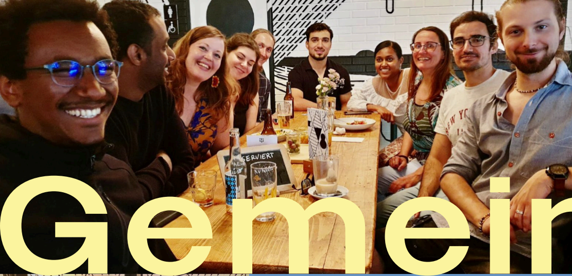
regelmässiger KUNIGO- Stammtisch im Neubad.